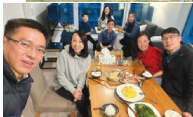
◀好友接待我們家聚