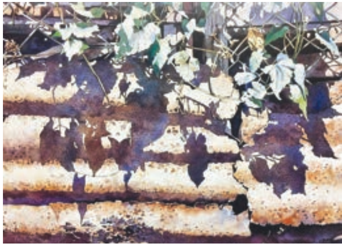
齊來享受陽光 1988年 當年很喜歡到鑽石山大礮村取景，那裡很多破舊鐵皮屋、電線和鐵絲網，葉子附著鐵絲網上，享受著陽光清風，平淡簡單、安穩，多麼美好的景象。