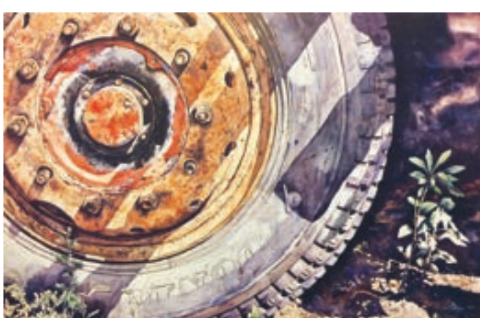
強與弱 1989年 在火炭工作室附近空地停車場，看見巨大的貨車輪吹，與外柔內剛的小葉子對峙著，猶如螳臂擋車，非常震撼。