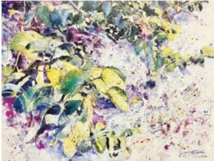
紫色浪漫 1991年 我嘗試用另一種手法去演繹一組樹葉，除葉子以較具象方式表現外，整幅畫都以大筆渲染，讓顏色水份任意流動，並以留白膠和鹽製造特殊肌理效果，令畫面充滿動感活力。