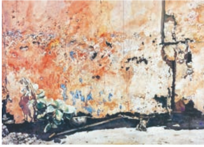
紅門 1988年 1988年開始創作葉子陽光系列。某日看到一棵植物，從一道狹窄的門縫中掙扎求存；巨幅的生鏽紅色鐵門壓著那細小植物，形成強烈對比。葉子表現出堅毅無比的生命力。