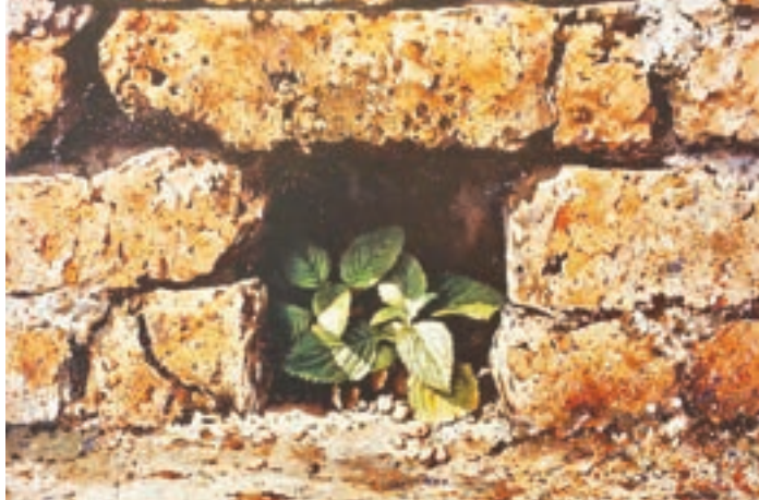
溫暖家庭 1990年 一組葉子，棲息於一個細小狹窄的方格空間，雖是擠迫卻和諧共處，彼此互融。啡褐色調子的紅磚，加上陽光的照耀，令畫面顯得特別溫暖和諧。