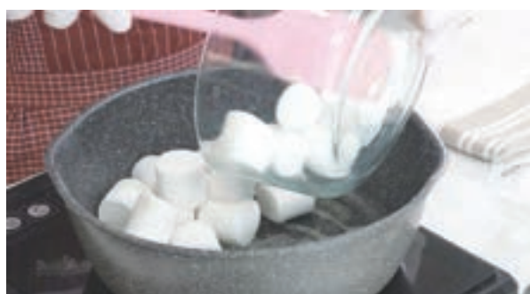
b) 煮溶牛油加入棉花糖