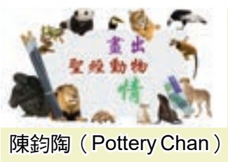
陳鈞陶 (Pottery Chan)