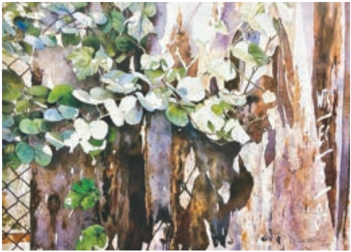
葉影 1988年 葉子在陽光下舞動，葉影投射在佈滿鏽漬的鐵皮上，明暗對比，表現出強烈的正午陽光。右邊的白色數字，相信是有關部門遷拆的註號，增加了生活的寫實感。