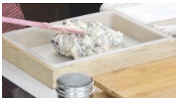
e) 煮好的糖倒在烘焙紙