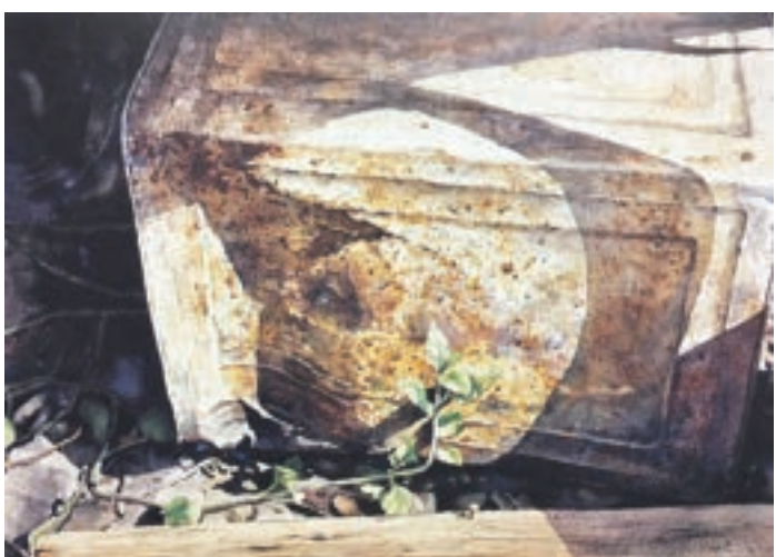
生命力 1989年 一個壓凹了的生鏽鐵罐，一棵頑強的葉子，在陽光的照耀下，表現出頑強的生命力及堅毅不屈的精神，給我們一個正面啟示。