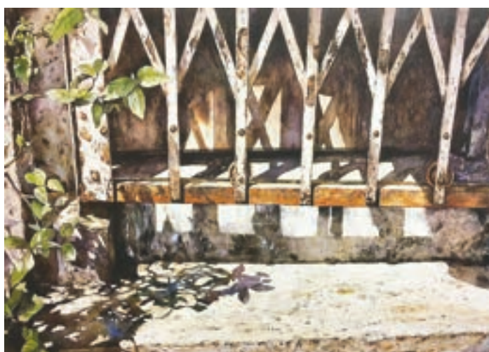
開工去 1988年 陽光早晨，戶主關上鐵閘去開工。鐵閘上的鐵鏽斑漬，表現出平民生活，努力工作，積極改善生活。