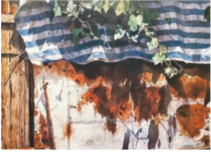
屋簷下 1988年 一道舊木門、生鏽鐵皮、藍白膠布及葉子陽光的組合，不同的質感，畫出簡陋純樸的生活。葉子在屋簷下，無憂地享受著清風送爽，以及悠閒的日光浴。