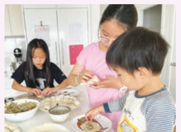
跟小孩子一起包雲吞