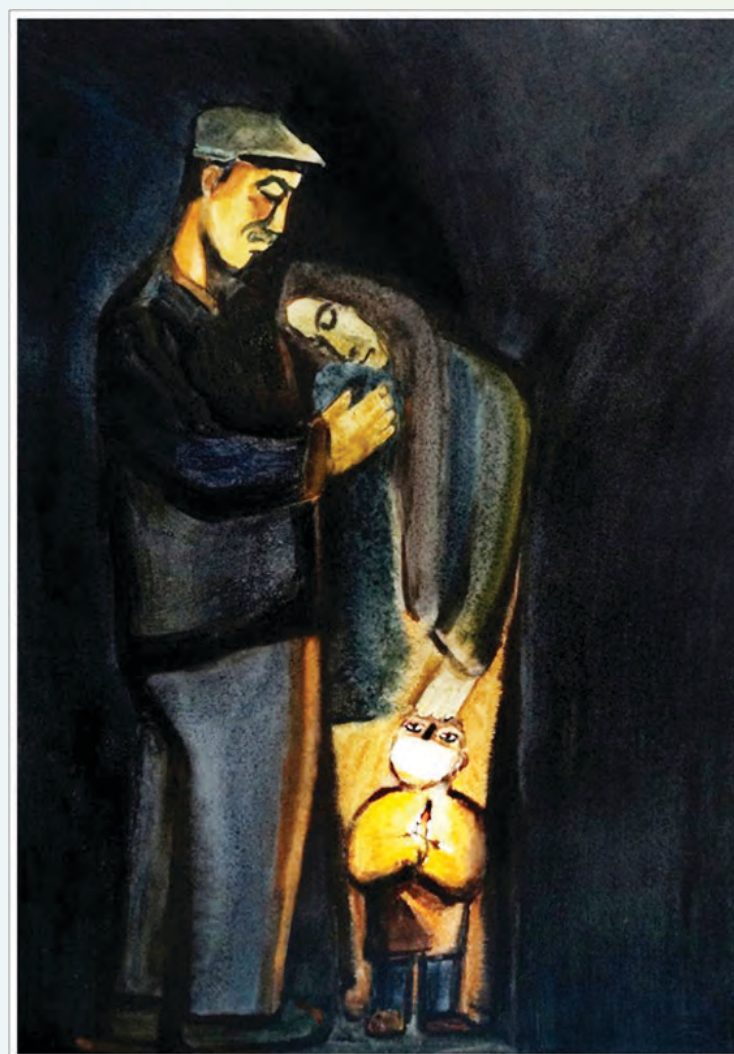
藝術家：鮑軍濤（中國） 題目：黎明即將到來 媒體：水彩 53x37cm

拉開窗簾，一輪紅日普照大地，美景竟然在現實中出現。我們常常預期將要面對的，就是痛苦恐懼和絕望，而忽略了天父大能。天父的大能足以扭轉挫敗，治癒傷痛。苦難的背後，就是天父更美的祝福。