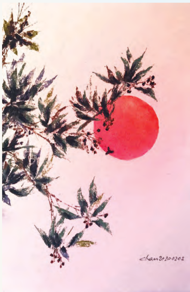
藝術家：陳慧忠（香港） 題目：栽種有時 拔出有時 媒體：粉彩210 x 297 mm

生命不在乎長短，重要的是活得有意義，活出神所賜的生命力。幾片柔弱的綠葉，在岩石底破土而出，展現出從神而來的生命力。疫情突顯生命的薄弱，我們必須仰望神，以神無限的愛，守望相助，用頑強的生命力去榮耀神。