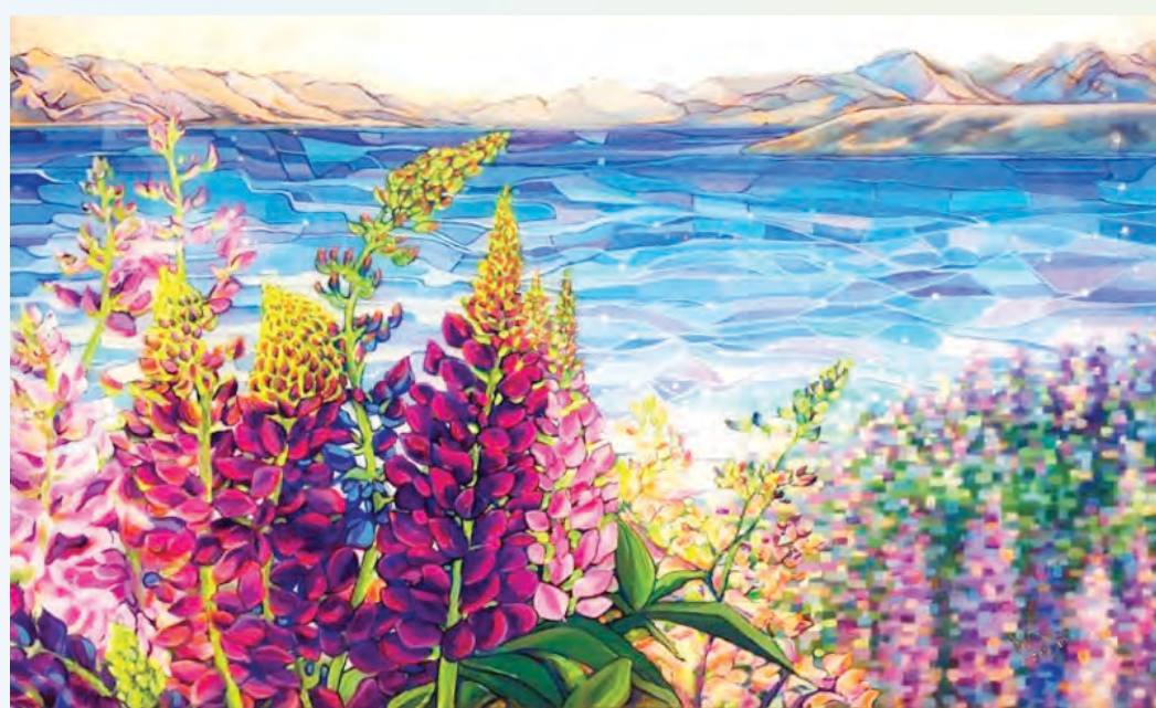
藝術家：Katrina Wang（加拿大） 題目：玻璃海 媒體：壓克力 90 x 60 cm

上帝容許事情發生，必然有祂的心意。遭逢逆境，我們都需要回歸上帝，反省反思，在其中找尋出路。今天我們與病毒共存，也在逆境中共存，如何接受不能改變的處境，是我們耐力的鍛煉。在患難中思想上帝的恩情和憐憫，就能夠衍生我們對上帝的盼望。