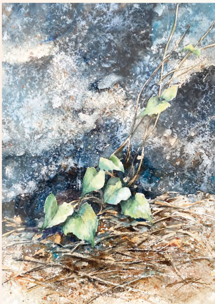
藝術家：游榮光（加拿大） 題目：生命力 媒體：水彩紙本38x28cm

生命不在乎長短，重要的是活得有意義，活出神所賜的生命力。幾片柔弱的綠葉，在岩石底破土而出，展現出從神而來的生命力。疫情突顯生命的薄弱，我們必須仰望神，以神無限的愛，守望相助，用頑強的生命力去榮耀神。