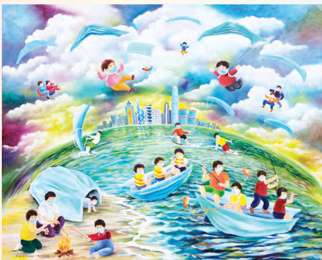
藝術家：周文志（香港） 題目：共存 媒體：油畫80x100cm

家庭作為最小的社會單元，是我們心靈的港灣。作品描繪了在疫情爆發的特殊環境下，家人之間的愛和溫情，有如在漆的黑夜裡，一同盼望黎明早日來臨。