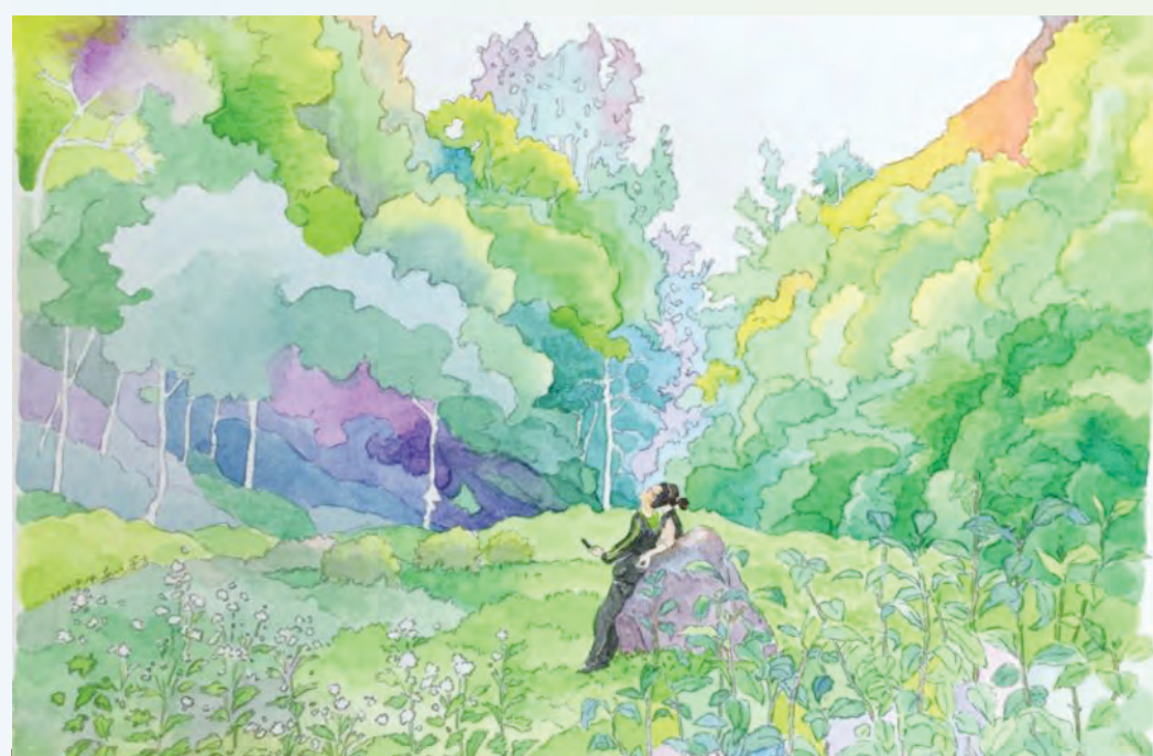
藝術家：段宇方（中國） 題目：傾心仰望 媒體：水彩14.8 x 21cm

寒冬過後，春臨大地，生機勃發，萬物滋長。疫情的困擾，總會有被克服的一天，只要我們有信心，靠主得力，發揚神大愛無疆界的精神，一起面對疫情的衝擊，最終必可獲勝，將榮耀歸與神。